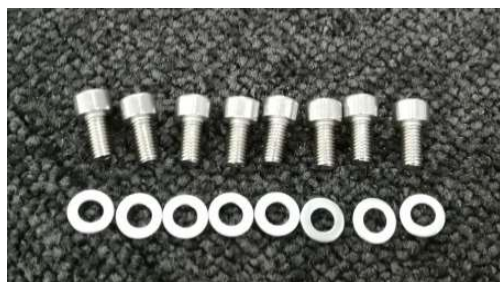
ブラケット固定ボルト